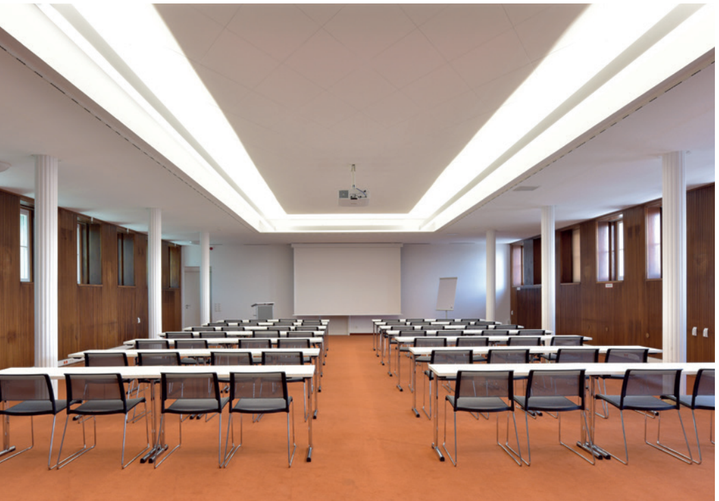
Der Konferenzraum »Hannover«

Sie planen eine Konferenz oder einen Workshop, organisieren Sitzungen oder Meetings und suchen einen passenden Tagungsraum in Berlin-Mitte in unmittelbarer Nähe zum Hauptbahnhof? Unsere fünf Tagungsräume bieten dafür das ideale Ambiente. Auf 29 bis 190 Quadratmetern finden bis zu 100 Personen Platz. Alle Räume verfügen über Tageslicht. Unsere Foyers und eine Dachterrasse mit Blick auf den Fernsehturm können für Empfänge und Sitzungspausen genutzt werden.