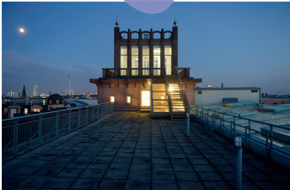
Dachterrasse und Foyer 5. Etage

Egal ob Podiumsgespräch, Konferenz oder Lesung — in den Räumen der 5. Etage können Sie flexibel verschiedene Veranstaltungsformate unterbringen — und den Bereich exklusiv nutzen. Zwei Foyers und eine Dachterrasse stehen zur Nutzung für Sitzungspausen oder Empfänge ebenfalls zur Verfügung.