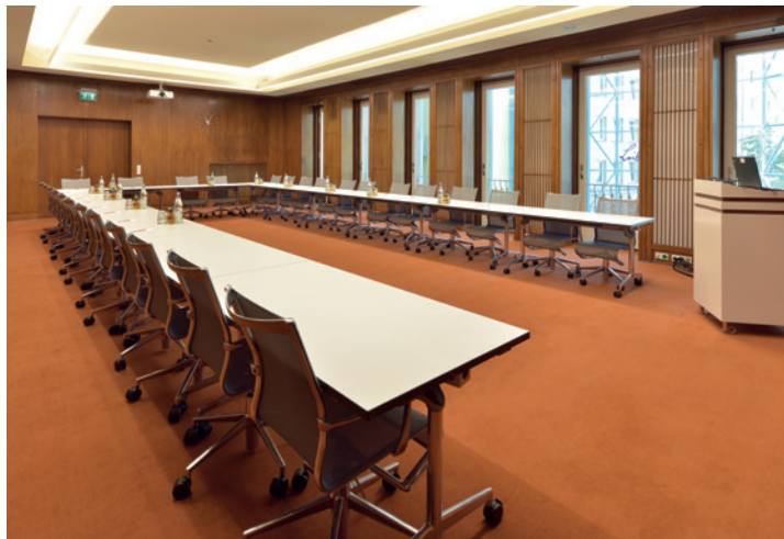
Die Konferenzräume »Leipzig« und »Berlin«

Drei unserer Konferenzräume befinden sich in der ersten Etage im Haus der Leibniz-Gemeinschaft. Mit einer Kapazität von 25 bis 80 Personen sind sie besonders geeignet für kleinere Sitzungen, Meetings und Workshops. Die denkmalgeschützten und aufwändig sanierten Räume, die ehemals die Industrie- und Handelskammer der DDR beherbergten, sind heute mit hochwertigem Mobiliar und modernster Präsentationstechnik ausgestattet.